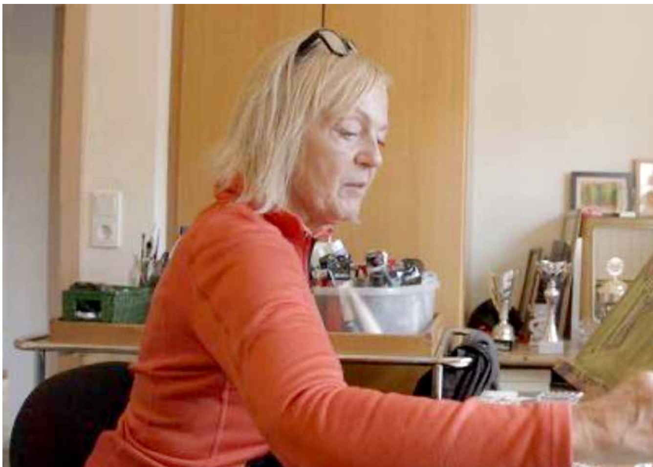
Frumkvöðull í útrás

sem gefur sig út fyrir að lækna fólk sem hefur fengið heila-blóðfall."