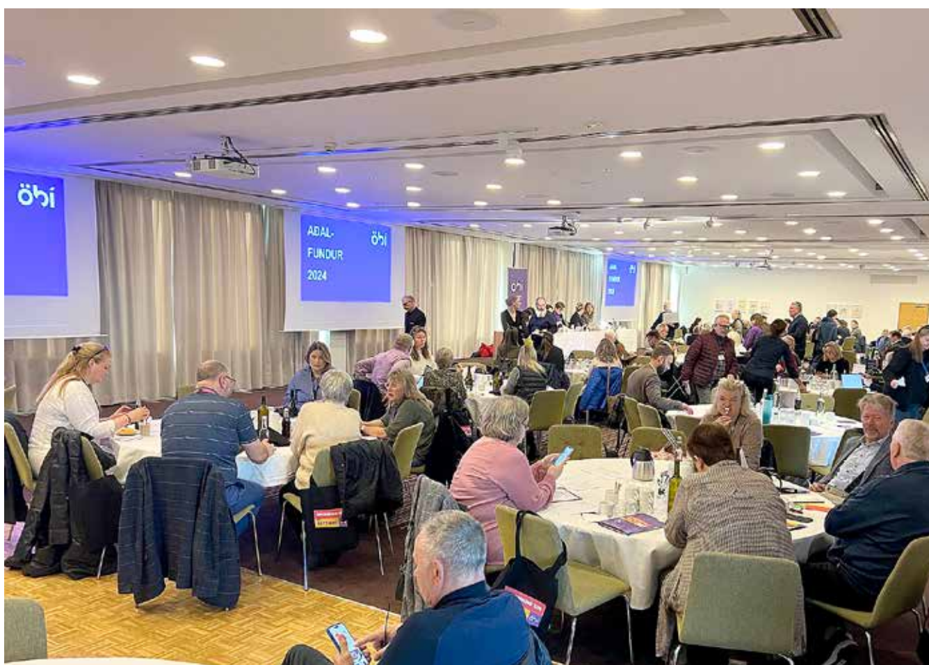
Aðalfundur mannréttindasamtakanna ÖBÍ var haldinn 4.-5. október sl. en Heilaheill hefur þar þrjá fulltrúa.